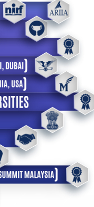
Governor Award (Fourth time)