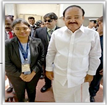
SRI VENKAIHAH NAIDU, VICE PRESIDENT OF INDIA CONGRATULATED FOR WINNING FIRST, SECOND AND THIRD PRIZE AT NIRDPR