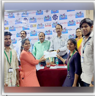
PLASTIC BRICK WON FIRST PRIZE AT OSMANIA UNIVERSITY