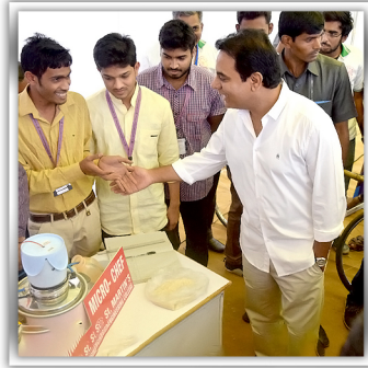
KTR, IT MINISTER OF TELANGANA CONGRATULATING ST. MARTIN'S ENGINEERING COLLEGE STUDENTS.