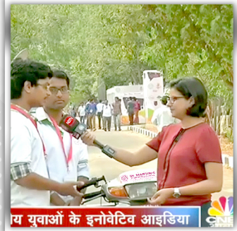
NDTV HAS INTERVIEWED OUR COLLEGE STUDENTS WHO CREATED REVERSE GEAR MECHANISM TO HELP PHYSICALLY CHALLENGED.